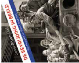
DE BEVRIJDING IN BEELD Van Nijmegen naar de Maas

Over de mislukte operatie Market Garden in september 1944 zijn talloze boeken verschenen. Maar over wat er daarna gebeurde, is (in Nederland) eigenlijk opvallend weinig op papier gezet. En dat terwijl de bevrijding van Zuidoost-Nederland en het Rijnland gepaard ging met de opbouw van een van de grootste legermachten in de geschiedenis. Begin 1945 waren in het al bevrijde (Rijk van) Nijmegen maar liefst één miljoen geallieerde militairen gelegerd. Zij moesten